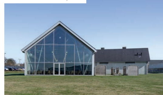
ENSI CAEN - Centre de formation d'ingénieurs