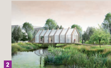
2 Halle et passerelle