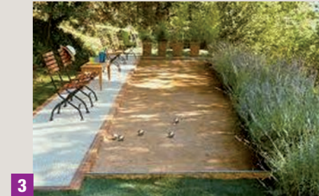
3 Terrain de pétanque