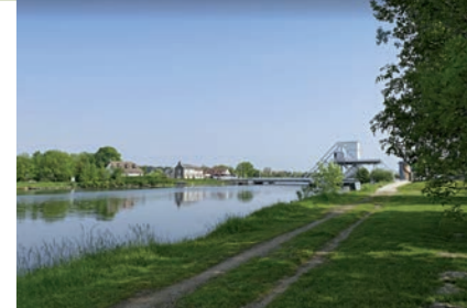
Le chemin de halage

Le chemin de halage , qui borde le canal de Caen à la mer, ouvre des vues exceptionnelles et offre des itinéraires de promenade remarquables.