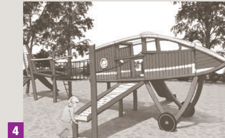
4 Aire de jeux

Qualité paysagère Cheminements doux et sécurisés Qualité architecturale