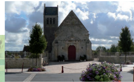
L'église et son chœur classé

Un cadre verdoyant et un patrimoine riche , propices à la promenade et aux activités de loisirs .