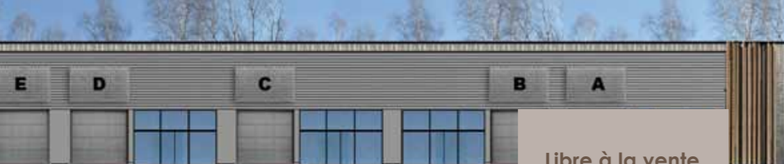
Façade Sud-Est, bardage métallique, grille pour support enseigne et porte sectionnelle.

Libre à la vente à partir de 1 300€ HT/m 2 le clos couvert