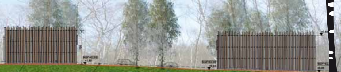
Façade Nord-Est, les madriers en châtaignier sur la façade s'intègrent à l'environnement boisé.

Site sécurisé Clôture Type Diricks gris foncé de 2m de hauteur Elle sera doublée d'une haie végétale