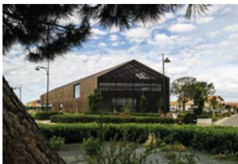
Référence Atelier Arcau