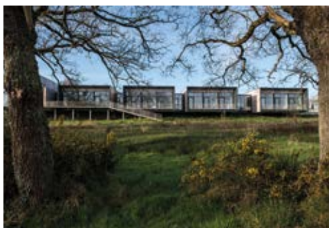
Référence Atelier Arcau